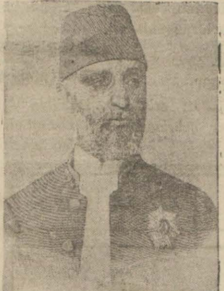
Hatıralara ismi karışan Sadrı esbak Tevfik Paşa

Meşrutiyet ilân edildiği zaman Abdülhamidî Selânikte Alâtinî köşkünde ikâmette memur etmişlerdi. İttihatçılar sabık Sultanın hareketini takip etmek üzere yanına bir de adamlarını koymuşlardı. Bu zat, Abdülhamidin halinden ölümüne kadar yanında bulunmuş, hergün beraber düşünmüş, bütün hayatını yakından takip etmiş, bütün gördüklerini, bütün işittiklerini muntazaman ve günü gününe notetmiştir. "Son Posta" bu notları